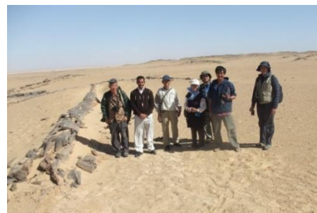
エジプト、古生物調査隊 左側に大木の化石